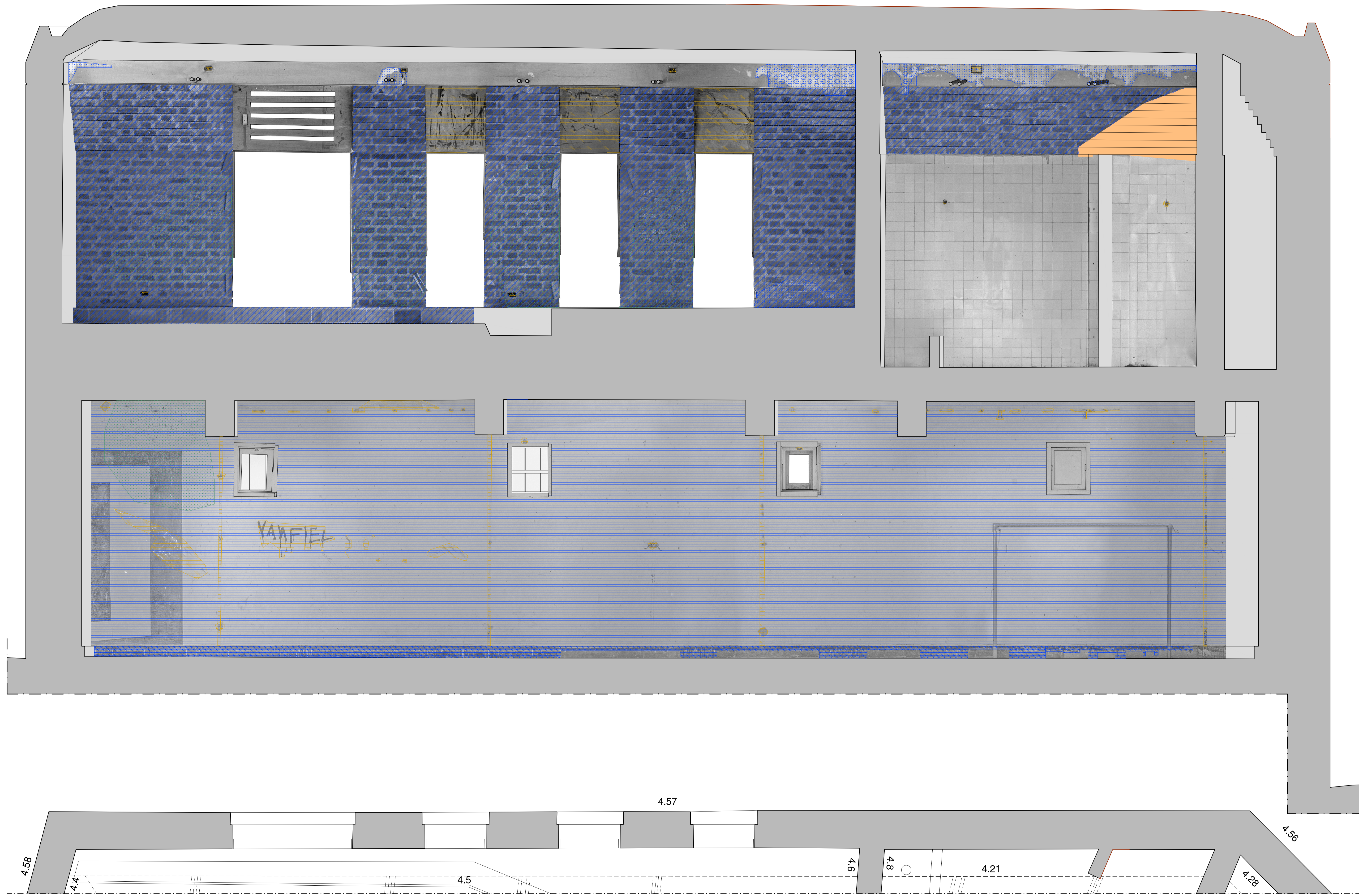
Paredes 5 y 21