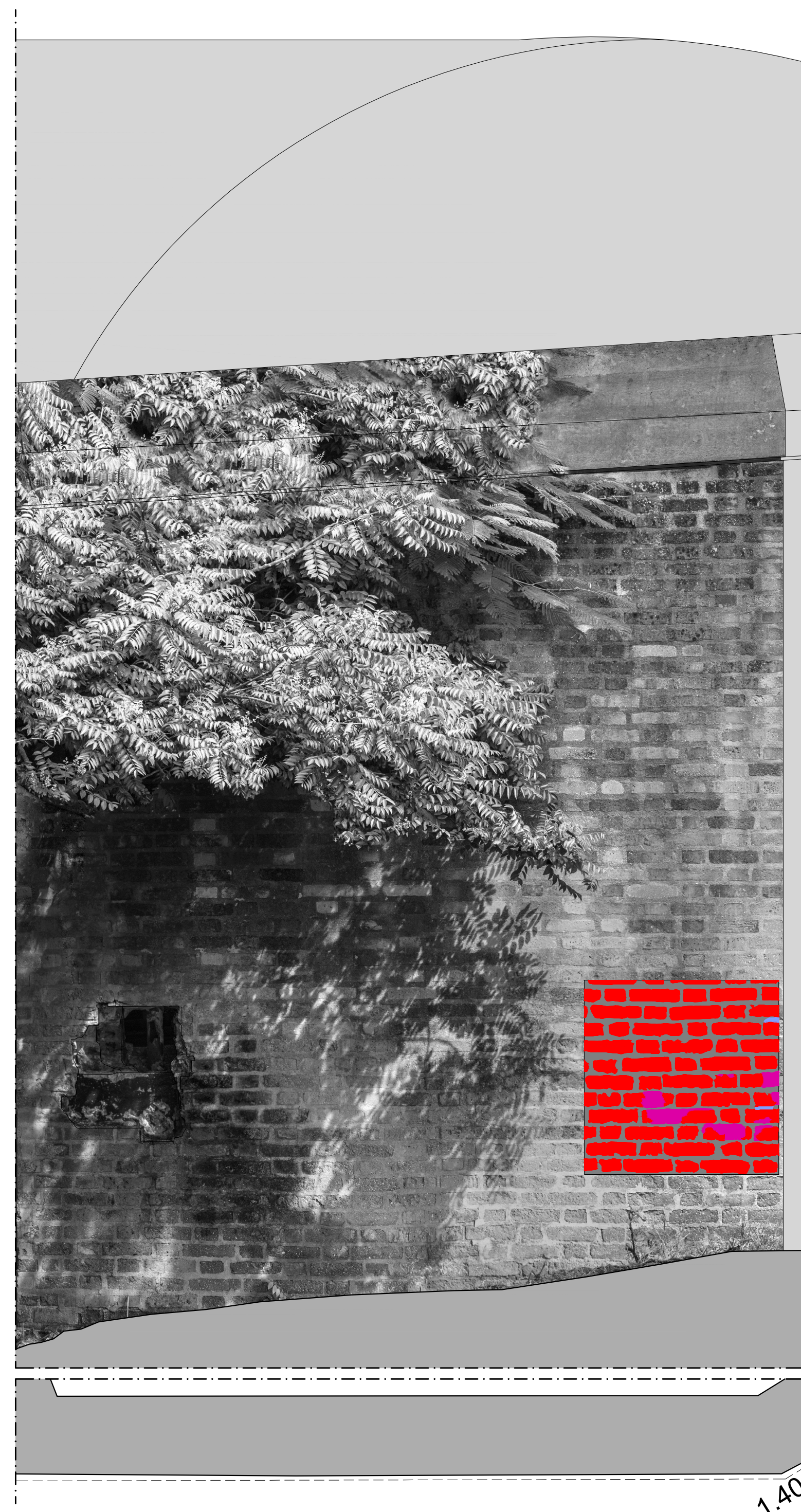
Pared 39 1.39 1.40